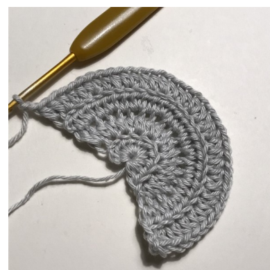
Efter rk 4

Rk 9 [7 hstm i bml, 2 hstm i bml i samme m] x 9 (i alt 81 hstm).