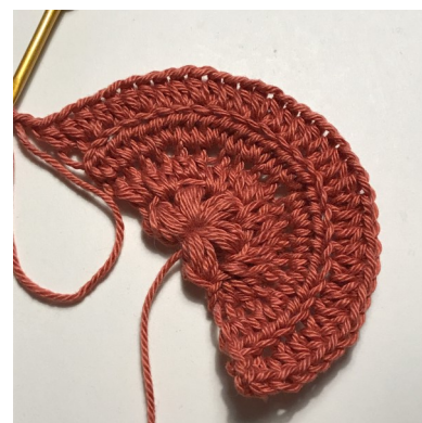
Efter rk 4

Rk 9 [7 hstm i bml, 2 hstm i bml i samme m] x 9 (i alt 81 hstm).