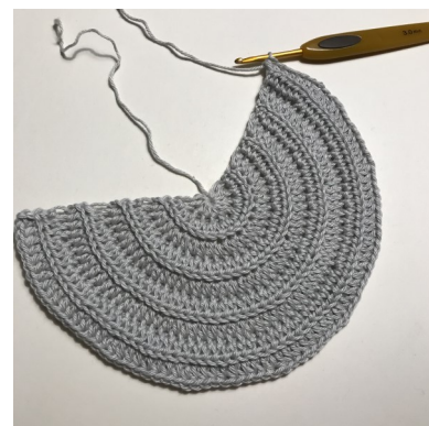
Efter rk 9