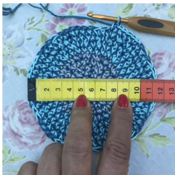
Efter omg 10. Diameter ca. 11,5 cm.