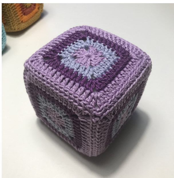
DEN FÆRDIGE TERNING

Hæft ende og gem garnenden på indersiden.